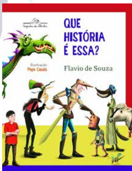
“Que história é essa?”

Flávio de Souza Editora Companhia das Letrinhas